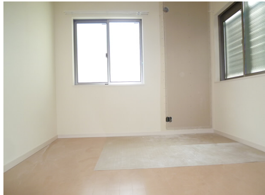
図面と現況が異なる場合は現況が優先となります。